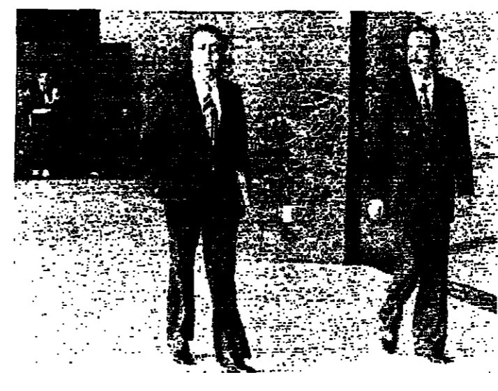
الوزيران خالد جنبلط وعلي خياط لدى مغادرتهم القصر الجمهوري امس

قدم وزيراً جبهة الشمال خالد جنبلط وعلي خياط امس استقالة خطية من الحكومة الى الرئيس سليمان فرنجية ، لكن الرئيس طلب من الوزيران الترشح على ان يبحث الموضوع في الوقت المناسب . وكان وزير المال السيد خالد جنبلط قد زار الرئيس رشيد الصلح في ديوانه بالدراسي ، والتقى بوزير الاشغال السيد جورج سماده . وبعد خروج الوزير الكندي ، ابلغ الوزير جنبلط رئيس الحكومة انه يهتم بتقديم الاستقالة الخطية التي كان قد وضعها في السابق الى رئيس الجمهورية . وقد حاول الرئيس الصلح حمل الوزير جنبلط على الترشح في موقفه لكنه اصر على تكيده امام رئيس الجمهورية .